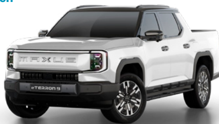
Pearl Lustre White