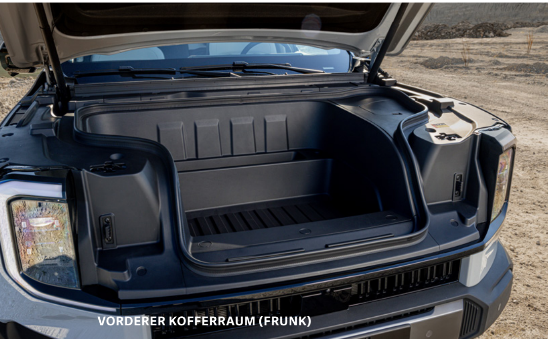
VORDERER KOFFERRAUM (FRUNK)